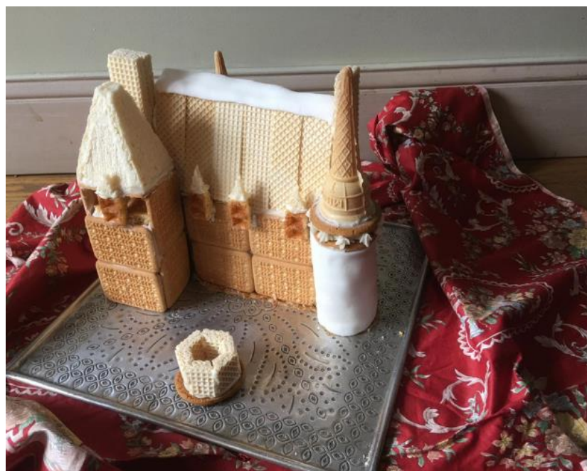
Réalisation à l'occasion d'un atelier Qui dit « château » dit « gâteau »