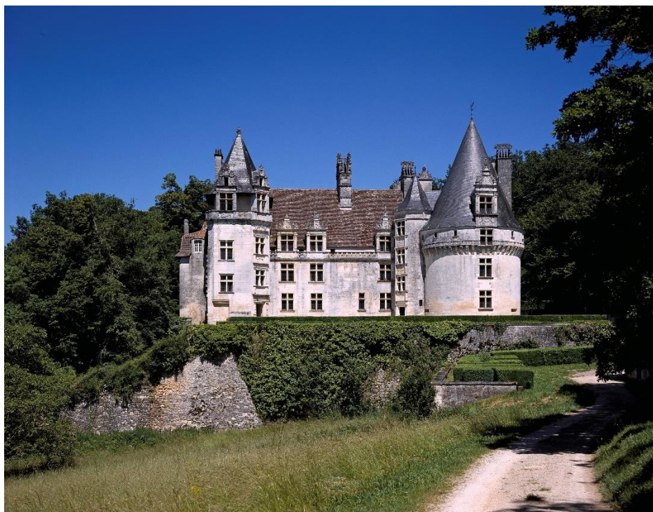
Château de Puyguilhem

Le château de Puyguilhem a été construit dans le premier tiers du XVI e siècle, sur l'emplacement d'un repaire médiéval, pour Mondot de La Marthonie, d'abord président du parlement de Guyenne, puis en 1515 du parlement de Paris. Ce juriste proche de François Ier seconda Louise de Savoie, mère du roi, lorsque celle-ci fut chargée des affaires du royaume pendant la première campagne d'Italie. La construction du château, commencée en 1510, était encore inachevée en 1517 à la mort de Mondot de La Marthonie. C'est son frère, évêque de Dax, qui mena les travaux à leur terme, en 1534.